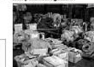
Bu informasiya texnologiyalarının tətbiqi qsa zaman ərzində tam inventarizasiyanın aparılması üçün əlverişli şərait yaradır.

"GS1 Azərbaycan" informasiya texnologiyaları bazasında ştrixli kodlaşdırmanın köməkliyi ilə müəssisələrin əmlakının tam inventarizasiyası və əsas vasitələrin və mal-məhsul qiymətlərinin avtomatik upotunun tətbiqi sistemini göstərir.