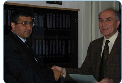
“Kəmal” elmi jurnah